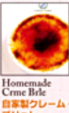
Homemade Crme Brle 自家製クレーム・ブリュレ