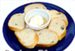
Bruschetta of Mascarpone & the Honey マスカルポーネと はちみつブルスケッタ