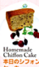
Homemade Chiffon Cake 本日のシフォンケーキ

Capall Uisce's Dessert Plate 1,180yen カプリシカのデザート盛り合せ (2名様盛り)