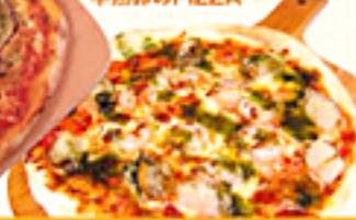
Genovese Flavored Seafood Pizza シーフードPIZZA ~ジェノベーゼ風~

Fresh Mozzarella Cheese & Basil Pizza フレッシュモッツアレラとバジルのPIZZA