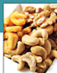
Mixed Nuts MIXナッツ

Bruschetta of Mascarpone & the Honey 480yen マスカルポーネと はちみつブルスケッタ