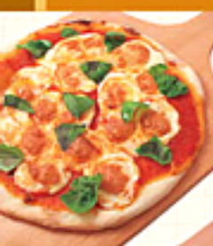
Fresh Mozzarella Cheese & Basil Pizza フレッシュモッツアレラとバジルのPIZZA