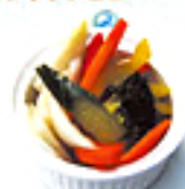
Homemade Pickles 自家製ピクルス