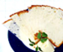
Homemade Irish Soda Bread 自家製ソーダブレッド