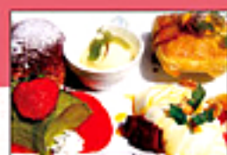
Capall Uisce's Dessert Plate カプリシカのデザート盛り合せ